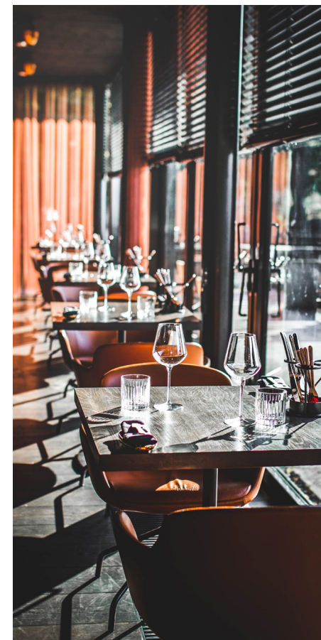
TEISED SIIGURI PERE RESTORANID

Grupimenüü võimalus alates 12 inimesest.